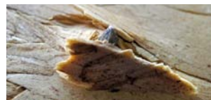
Otro Clavo 2