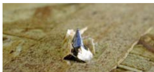
NUEVO CLAVO Teja Asfáltica INCHALAM