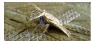
Otro Clavo 3