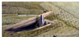
Otro Clavo 1